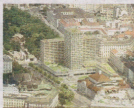
Das geplante Hochhaus.