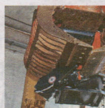
Ein zerstörter Wett-A

Verantwortung. Die Bürger- initiative gegen den Tojner- Tower ruft außerdem die Bundesregierung auf, Ver- antwortung zu überneh- men. „Worauf wartet die Bundesregierung? Kultur- minister Blümel stehen alle Möglichkeiten offen, das Kulturerbe zu schützen“, sagt Christian Schuhböck von „Alliance vor Nature“.