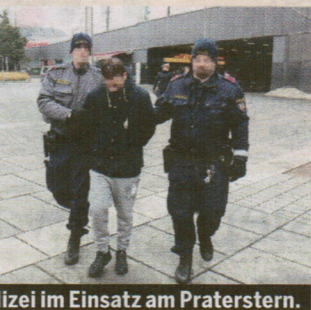
izei im Einsatz am Praterstern.

affenverbot: So lief der ster Tag am Praterstern